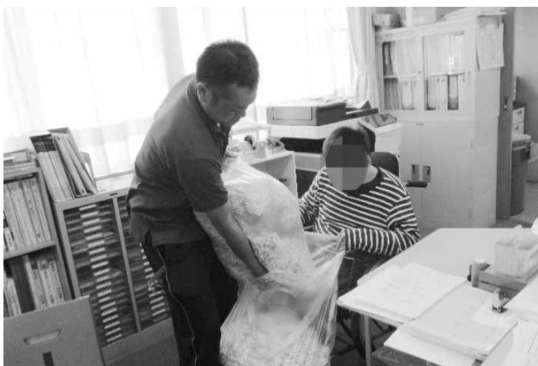
率先して職員との関わりを楽しみながら仕事をするKさん

居室で過ごすことが少なくなり、談話室で職員との関わりを楽しむ時間が増えてきた。談話室ではタオルたたみやシュレッダー作業など自発的に行ない、「できるよ。すごいでしょ。」と自分の力をアピールすることが増えた。また、周囲もそれを受け入れることで、受容されたと感じ不安感の軽減に繋がっていった。